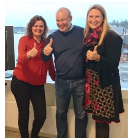
Faglærer, kursleder og bestiller i Midt-Troms – fornøyde!