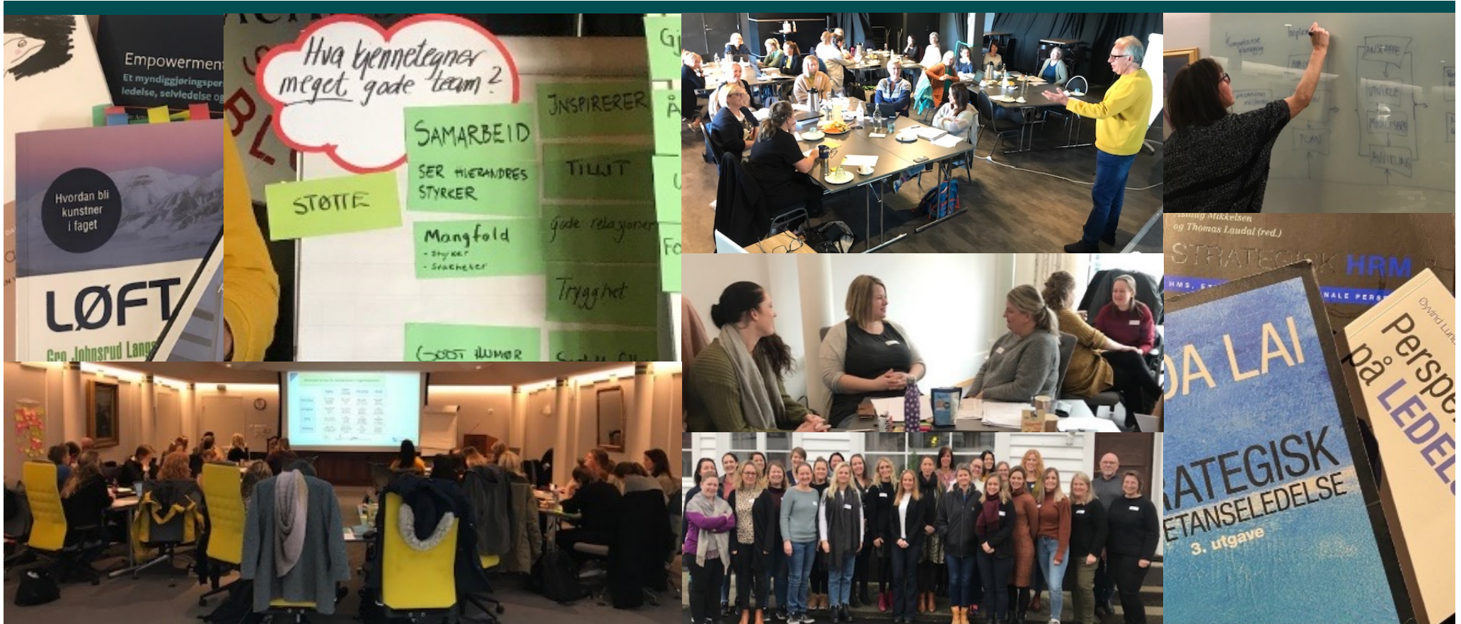
(Bilder fra Sør-Helgeland, Flekkefjord og Kvinesdal og Sykehuset Sørlandet)